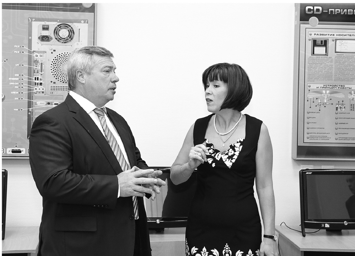
● И школы, и учителя готовы к новым стандартам обучения

– Два новых «И» в стратегии развития области – индустриализация и интеллект – это ваши учительские «И». Может показаться, что они не связаны, но это не так. Между ними есть непосредственная зависимость, – уверен губернатор.